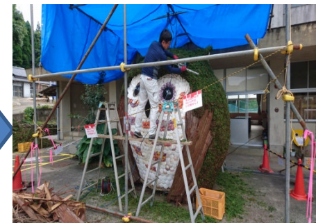
杉の葉をカットして成形