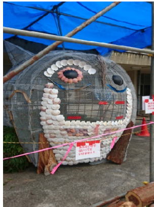
前面を貝・浮きで装飾