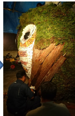
羽を杉の皮で装飾