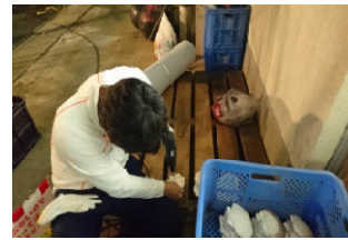
装飾用杉の葉・貝下準備