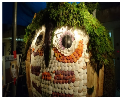
ススキや貝で装飾追加