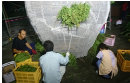
フクロウ胴体に杉の葉差し