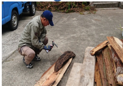
流木でくちばし作り