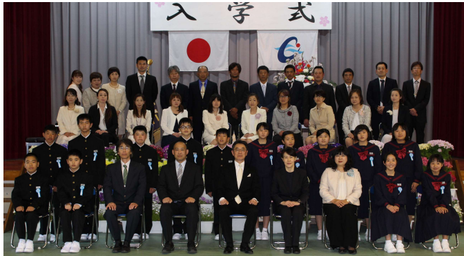
入学式後の記念撮影