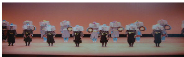
H26年度県PTA大会でも披露

私は、同じ集落に住んでいる方が指導してくださると聞いて安心しました。練習では、大きくて見やすい楽譜を用いて教えていただき、わかりやすく早く覚えることができました。9月の本番では、笠と衣装も身につけ、みんなが心を一にして、楽しく踊ることができました。少しまちがえましたが、長島町の伝統文化の一つでもある鐘踊りを踊ることができてうれしく思いました。