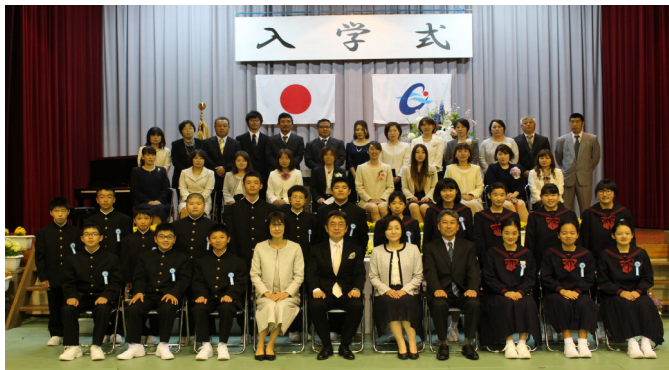
入学式後の記念撮影